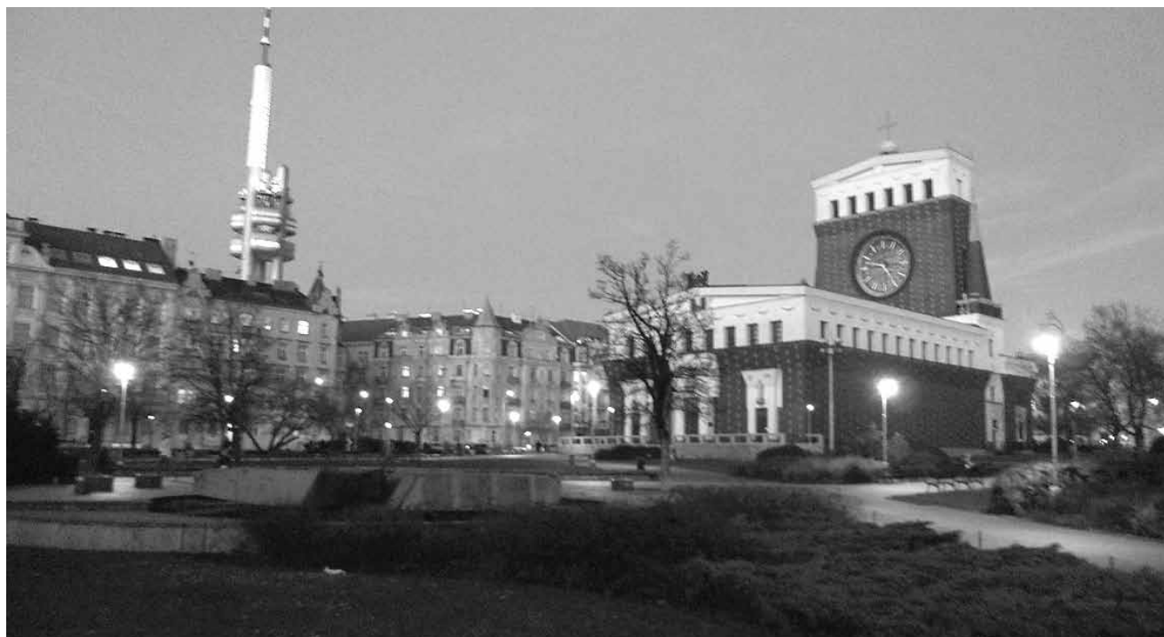
Jiřího z Poděbradyn aukio: Tšekkiläisen veljeskunnan kirkko keskellä, taustalla Žižkovin tv-torni.

11.7.1987 (seuraava Želivskéhon jälkeen), B-linja jatkui puolestaan länteen Smíchovské nádražíltä 26.10.1988 avatuilla Radlická, Jinonice ja Nové Butovice -asemilla. Skalka otettiin käyttöön A-linjan itäiseksi pääteasemaksi 4.7.1990 ja saman vuoden, syksyllä 22. marraskuuta B-linja jatkui Florencista pohjoiseen neljällä asemalla Křižíkova, Invalidovna, Palmovka ja Českomoravská. Seuraavaa laajennusta saatiin odottaa nelisen vuotta, 11.11.1994 alkoi B:stä tulla jo pisin linja, kun länteen avattiin Hůrka, Lužiny, Luka, Stodůlky ja Zličín. B-linja saavutti nykyisen pituutensa 8.11.1998, kun Českomoravskálta eteenpäin avattiin asemat Vysočanská, Rajská zahrada ja Černý Most. Kaksi väliasemaa B-linjalle on tullut vielä myöhemmin eli Hloubětín (15.11.1999) ja Kolbenova (8.6.2001).