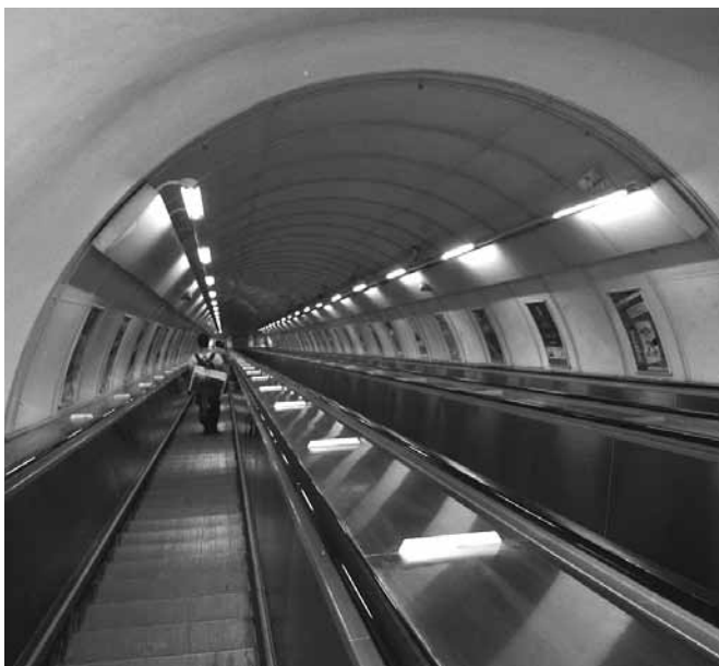
Hradčanskán pitkät rullaportaat.

Vaihtoasemilla C-linja kulkee lähempänä maanpintaa: Muzeum 10 m vs A-linjan laiturit 34 m syvyydessä ja Florencissa ero vieläkin suurempi 9,4 vs B-linja 39 metriä. Můstekilla A:n laiturit on 29,3 m ja B 40,3 metrin syvyydessä. Laiturityyppejä on kolme: yhteinen keskikäytävä ja laiturit pylväiden takana (yleinen "syvillä" asemilla), yhteinen laituritaso keskellä sekä C-linjan "vääränpuoleiset", joilla junat kulkevat vierekkäin keskellä ja laiturit ovat reunoilla: Vyšehrad, Hlavní nádraží, Střížkov ja Prosek. Rajska zahrada on poikkeustapaus, toistaiseksi ainut asema, jolla junat kulkevat kahdessa kerroksessa: alempana Černý Mostiin ja ylempänä keskustaan, Zličínin suuntaan. Se sai arkkitehtuuripalkinnon, "vuoden rakennus" 1999. Metrovarikvoja, "depo"on kolme: Zličín, Kačerov ja Hostivář.