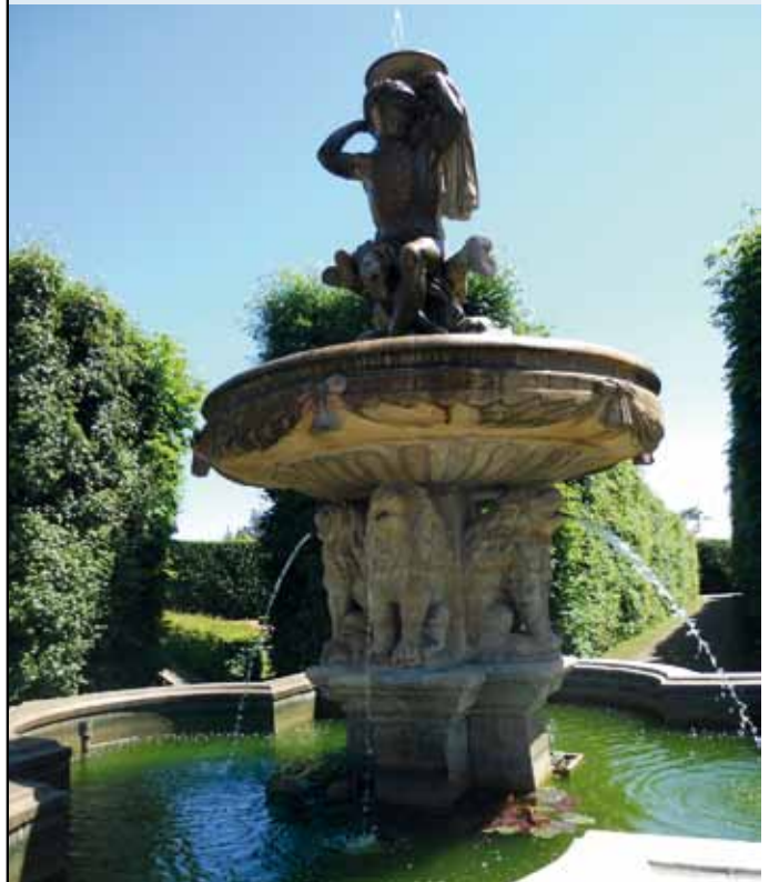
Kromeriz, suihkulähde