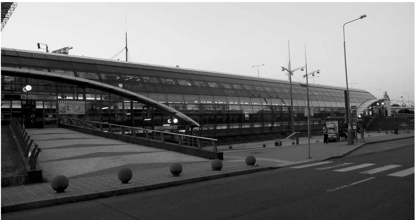
Rajská zahradan palkittu asema ulkoapäin.

Metroverkoston laajeneminen ei suinkaan ole päättynyt tähän... A-linja pidentyi Strašnickälle