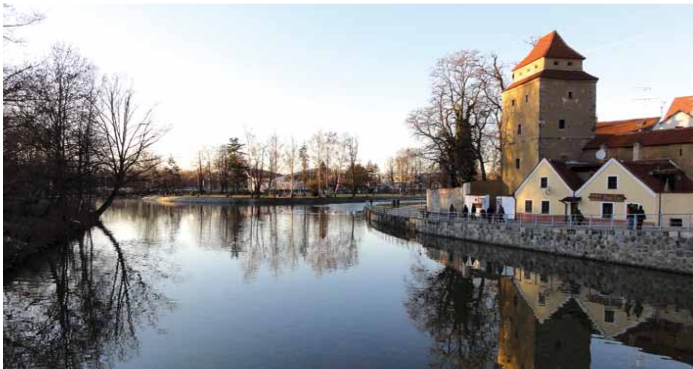
České Budějovice, talvipäivän tunnelmaa, Malše-joen sillalta Vltavan suuntaan.

kokielen. Kummatkin säilyivät sitä voimakkaamman katolisen kirkon rinnalla aina slovakkiensa kansalliseen heräämiseen saakka, ja siitäkin eteenpäin, mikä osaltaan vaikutti myönteisesti tšekkiä ja slovakkiä yhteisen valtion syntymiseen vielä ensimmäisen maailmansodan viimeisissä myrskyissä.