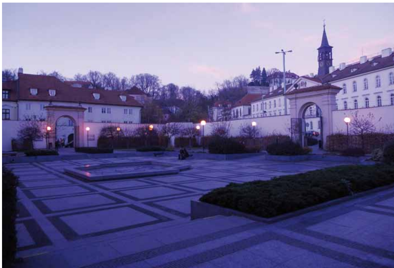
Praha, Malostranská-metroaseman puutarha illan hämärtyessä.