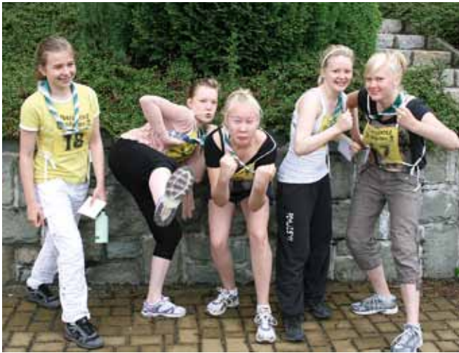
Lauantaina osallistuimme paikalliseen kilpailuun.

limme, olivat kylmiä, pimeitä ja ahtaita. Museoiden jälkeen oli aika lähteä shoppailemaan kaupungin suurimpaan kauppakeskukseen Nová Karolínaan.