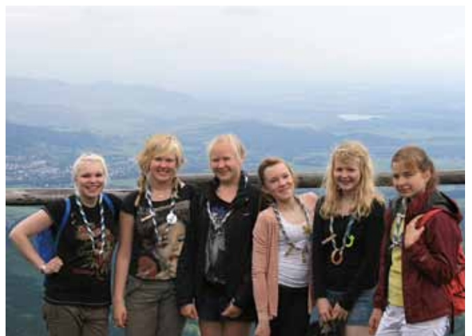
Suomalaistytöt Lysá Horan huipulla.

Huippu alkoi viimein hämmöttää, ja saimme ruokaa. Matka alaspäin sai alkaa, kun olimme hetken saaneet levätä ja ihailta maisemia. Alaspäin olikin huomattavasti helpompaa mennä.