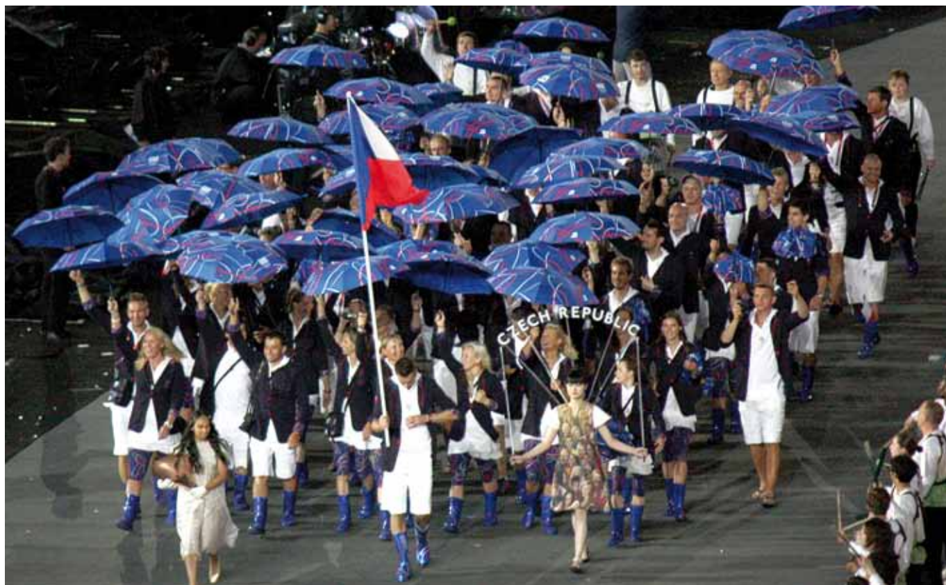
Tšekin joukkue Lontoon kesäkisojen avajaisissa.

sa. Lopussa Kreuziger ei kuitenkaan päässyt mukaan ratkaisevaan irtiottoon, ja hän tuli maaliin viidentenätoista häviten kahdeksan sekuntia voitajalle. Kilpailun jälkeen Kreuziger sanoi haastattelussa, että sen jälkeen, kun kärkijoukosta karkasi lopullinen voittaja, Kazakstanin Aleksander Vinokurov , ei olisi ollut herrasmiesmäistä yrittäjä ottaa häntä kiinni, koska kyseessä on hänen kollegansa ammattijoukkue Astanasta. Pyöräilyn tunteville kannattajille tämä on ymmärrättävää. Suurella todennäköisyydellä kumpikaan ei olisi hyötynyt kiinniotosta mitään, vaan Kreuziger olisi vetänyt mukanaan kirmiehiä, jotka olisivat loppusuoralla menneet molempien ohi. Muiden kannattajien silmissä Kreuziger on kuitenkin petturi.