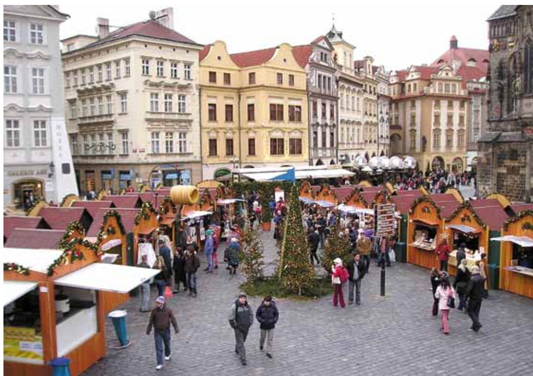
Prahan joulua Vanhankaupungin torilla.