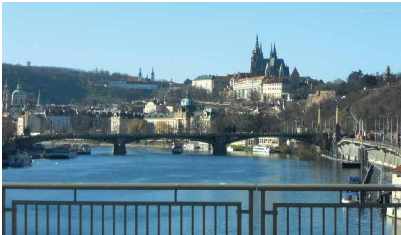
AE-bussin ikkunasta Štefaníkův mostilla, ennen Letnán tunnelia.

neksi syvimmällä sijaitseva, 43 metriä. Se ei ole nimensä mukaan kuitenkaan paras mahdollinen, jos on Prahan linnaan menossa. Raitiovaunuista Hradčanskálla pysähtyvät nrot 1,8, 15, 18, 20, 25 ja 26. Niistä linnaan pääsee suoraan 25:llä Pohorelecín pysäkillä, siitä sitten kävellen suoraan Loretan ohi, niin tulee väkisin portille, jossa voi nähdä kuuluisan vahdinvaihtoseremonian. Malostranská on varsinainen portti linna-alueelle, Staré zámekké schoďy-portaat lähtevät heti metroaseman vierestä. Malostranská on yksi viihtyisimpiä asemia, ainakin kesäaikaan, omassa puutarhassa voi nauttia virvokkeista, ennen kuin jatkaa metromatkaa. Suora yhteys on myös raitiovaunuihin 12, 18, 20 ja 22, joiden pysäkki on heti metroaseman edessä.