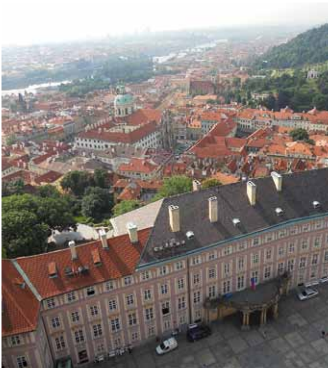
Pyhän Vítuksen katedraalin tornista Malá stranaan.

HUOMIOITA ERI ASEMITLTA JA NIIDEN LÄHIYMPÄRISTÖSTÄ: Monet suomalaiset tekevät varmaan edelleen ensimmäisen metromatkan Prahassa Dejvickálta eli nousevat lentokentällä bussiin 119. Parin vuoden kuluttua Dejvická ei ole enää A-linjan pääteasema, kun Červený Vrch, Velešlavín, Petřiny ja Motol valmistuvat. Silloin tulee lisää vaihtoehtoja kenttäkuljetuksiin... Dejvická sijaitsee varsin vilkkaan liikennesolmun, Vítězné náměstín länsilaidalla ja Evropská-valtaväylän alkupäässä. Seuraava asema on Hradčanská, kolman-