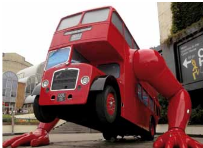
David Černý: London Booster.

Tämän vuoden olympiakisat olivat Tšekille menestyksekkäät kulttuurinkin puolelta. Edustusjoukkueen onnistui herättää koko maailman mielenkiinto humoristisella urheiluasustekokonaisuudellaan. Kaksikko Hlaváčková ja Hradecká sekä Kulhavý esiintyivät saappaat jalassa jopa palkintojenja-