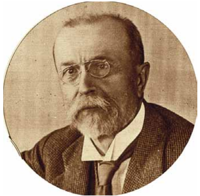
Masaryk 1900-luvun alussa.

Vuonna 1867 perustettu kaksoismonarkia merkitsi slovakeille lähes lopun alkua, kun unkarilaiset pääsivät herrakansaksi Leithan-joen itäpuolisessa valtakunnan osassa aikoen unkarilaistaa sen väestön. Huolimatta siitä, että itse keisari oli avustanut slovakkeja heidän pystyttäessään kansallista instituutiotaan, lähinnä kirjastona toimivaa ”Mati-