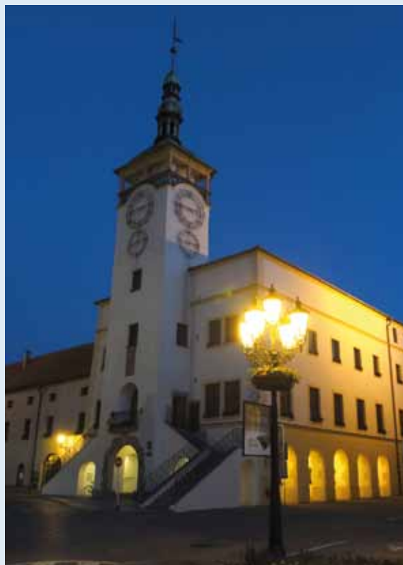
Kroměřížin raatihuone iltavalaistuksessa.