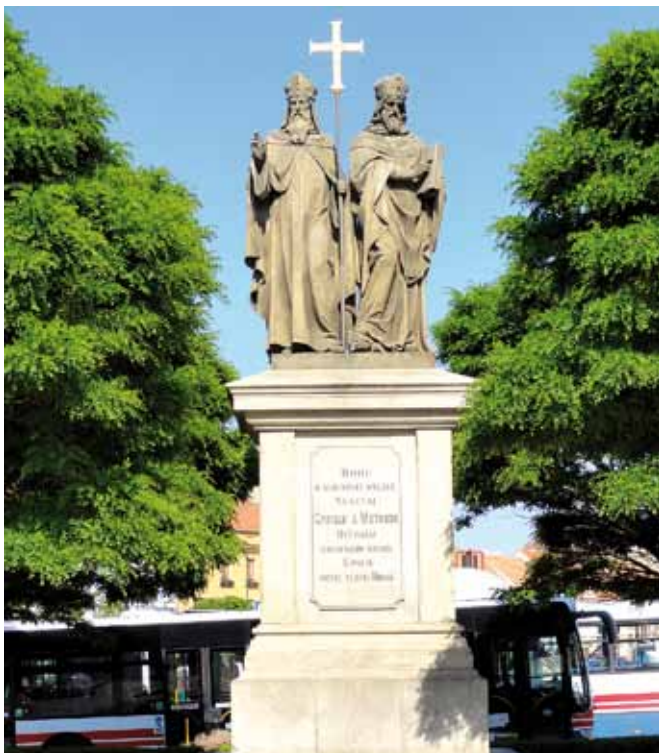
Třebíč, Cyril ja Metod (Kyrillos ja Methodios).

Hussilaissotien aikana 1400-luvulla voittoisat tšekkiprotestanttien joukot etenivät Slovakiaan asti. He tosin tuhosivat siellä yhden kaupungin, mutta jättivät jälkeensä sinne protestanttisen uskon ja tšekkiläisen mestari Jan Husin uudistaman kirk-