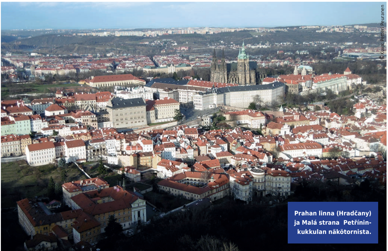
Prahan linna (Hradčany) ja Malá strana Petřínin- kukkulan näkötorista.

Sitä vastoin toinen asutusaalto, joka tunnetaan, paitsi ulkoisena tai suurena asutusaaltona, tarkoitti maahanmuuttoa ulkomailta, etupäässä saksalaisen väestön tuloa maahan. Se muutti perusteellisesti tšekkiläistä yhteiskuntaa. Tämä historiallinen kysymys tuli aikanaan heijastumaan 19. vuosisadalta aina toisen maailmansodan jälkeisiin aikoihin