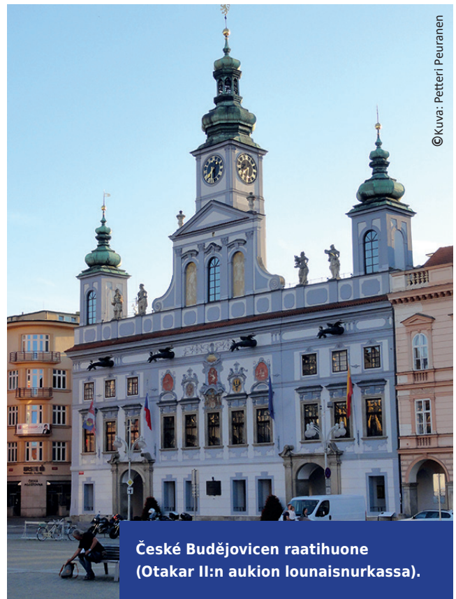
České Budějovicen raadihuone (Ottakar II:n aukion lounaisnurkassa).

Ylhäisaatelia täydensi alempi aatelisto: ritarit, tilanomistajat, maalaisherrasmiehet, hallitsijan tai ylimyksen saattueeseen tai henkivartiostoon kuuluivat ja muut ns. vapaasyntyiset. Heillä ei ollut suurta omaisuutta ja maan hallintoon heillä ei ollut juuri