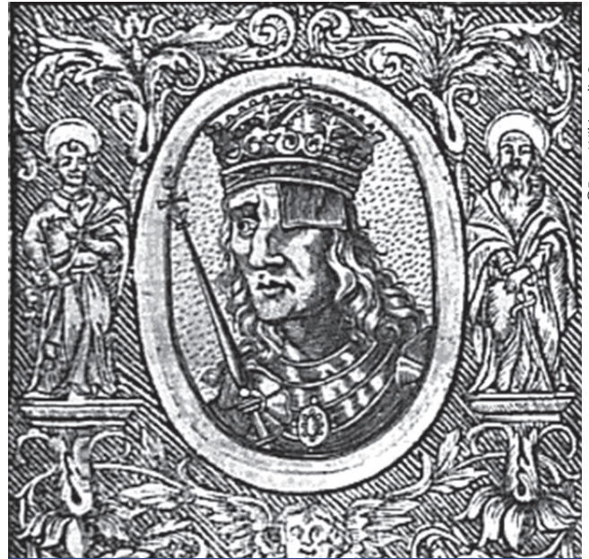
Václav I (1205-1253) hallitsijana vv. 1230-53.

Vuonna 1250 Itävallan hallitsijan seuraajakysy-