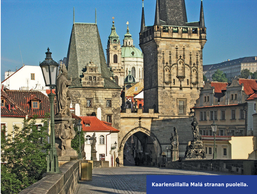
Kaarlensillalla Malá stranan puolella.