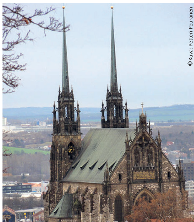
Brnon Pietarin ja Paavalin katedraali 1100-luvulta.