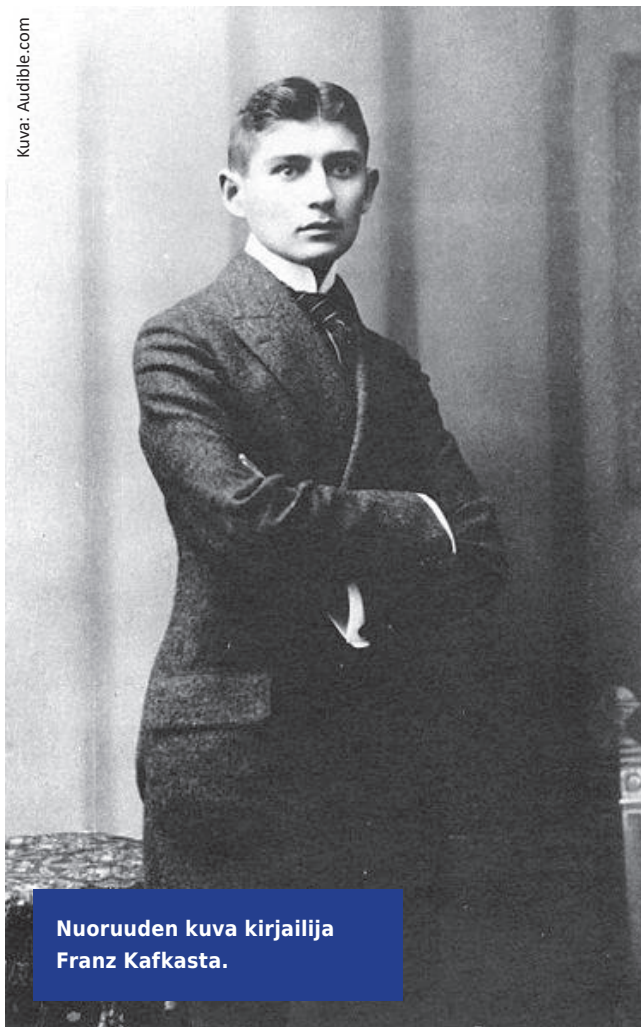
Nuoruuden kuva kirjailija Franz Kafkasta.

Der Prozess vuonna 1960. Esim. Sämtliche Erzählungen -kirjaa, jonka kannessa nähdään Kafkan piirros ratsastajasta hevosen selässä, vauhdikkaassa menossa, oli painettu 857 000 kappaletta vuoteen 1993 mennessä. Fischerin taskukirjoja on luettu Suomessakin.