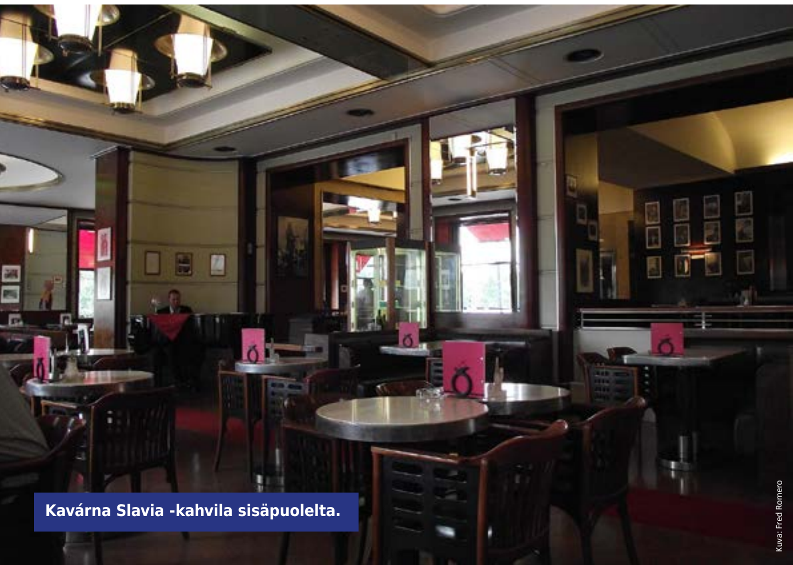
Kavárna Slavia -kahvila sisäpuolelta.

K ultaisessa kaupungissa on vierähtänyt eripituisia jaksoja neljän päivän pikapyrähdyksistä lähes kahdeksan kuukauden stipendi-aattielämään. Prahasta on muodostunut minulle pakkomielle, kaupunki, jonne minun täytyy aina palata. Moni on kysynyt, miksi juuri Praha. En ole enää pitkään aikaan osannut vastata tähän kysymykseen. Yhtenä syynä paluuseeni Vltavan rannoille lienevät kuitenkin Prahan kahvilat. Minusta on kehittynyt vuosien varrella kelpo kahvilapummi. Vetelehdin hankkimallani "ammattitaidolla"