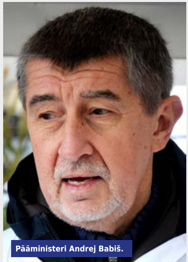
Pääministeri Andrej Babiš.

puhui asiasta TV-Barrandovin haastattelussa. Hän toisti uudestaan kannattavansa äänestyspakkoa. Sisäministeriö suunnittelee vaalilain muutosehdotusta siten, että äänestämään tultaisiin jatkossa vain perjantaina. Muihin uudistuksiin kuuluvat kirjeäänestys ulkomailla ja vaalilistojen pakollisen toimittamisen lakkauttaminen. Sisäministeri Jan Hamáček (ČSSD) lähetti ehdotuksen huomautuskäsittelyyn, minkä jälkeen se vasta menee hallitukselle ja parlamenttiin. 8.11.