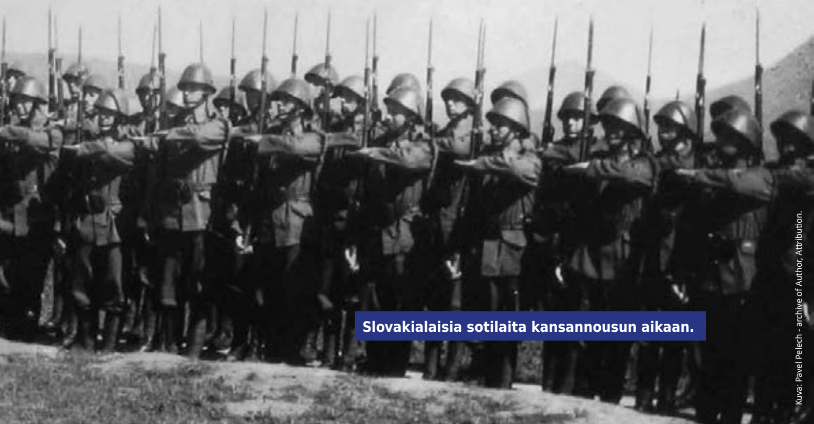
Slovakialaisia sotilaita kansannousun aikaan.

Slovakian sodanaikaisen tasavallan presidentin, pater Jozef Tison hallitus otti yhä enemmän poliittista mallia natsi-Saksasta, jonka vasallivaltio se käytännössä oli ollut perustamisestaan maaliskuusta 1939 lähtien, ja ehkä osin myös fasistisesta Italiasta. Yksipuoluejärjestelmä maassa jo oltua valtaa piti kansallispopulistinen HSLS (Hlinková slovenská ľudová strana), jonka jäseniä kutsuttiin lyhyesti ľudákeiksi . Nämä siirtyivät suurvaltaliittolaistensa vaikutuksesta vielä enemmän oikealle kohti oikeistodiktatuuria, jossa maan katolisella papistolla oli vaikutusvaltainen asema. Slovakian järjestelmää onkin jälkepäin kutsuttu kleriko-fasistiseksi. Tiso itse omaksui ”Johtajan” (Vodca) arvonimen, ja juutalaisia ryhdyttiin kuljettamaan keskitysleireihin Slovakian parlamentissa hyväksytyjen, Saksan mallin mukaisten rotulakien perusteella. Noin 60 000 juutalaista ehdittiin kuljettaa Saksaan tuhoamisleireille, kunnes paavi Pius XII puuttui asiaan ja kielsi juutalaisten kuljetukset. Itsekin katolisena pappina presidentti Tiso oli velvollinen noudattamaan paavin käskyä. Saksalaisten miehitettyä maan syksyllä 1944 juutalaisten kuljetukset leireille ja kaasukammioihin alkoivat uudelleen. Jo varhain hallitsevan Ľudák -puolueen ”Hlinka-kaartit” saivat saman aseman kuin SS:llä Saksassa, ja parlamentti hyväksyi lain eriarvoisista säädyistä. Slovakialainen histo-