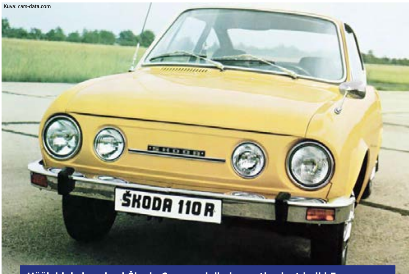
Häälahjaksi pari sai Škoda Coupén, jolla he matkasivat halki Euroopan.

kunnolla starttiongelmien syyn löytymiseksi. Purimme kolmannen kerran taas muuttolaatikot ja menimme syömään läheiseen ravintolaan. Myöhemmin iltapäivällä menimme sitten katsomaan automme tilannetta. Mukava ja ilmeisen ammattitaitoinen huoltomies oli löytänyt syyn ongelmiin. Auton laturi oli viallinen, ja hän pystyi korjaamaan sen niin, että pystyimme jatkamaan kotimatkaa Vantaalle. Jouduimme sitten myöhemmin uusimaan koko laturin. Isäni oli oikeassa, niin kuin isät usein ovat. Pääsimme vihdoinkin kotiin.