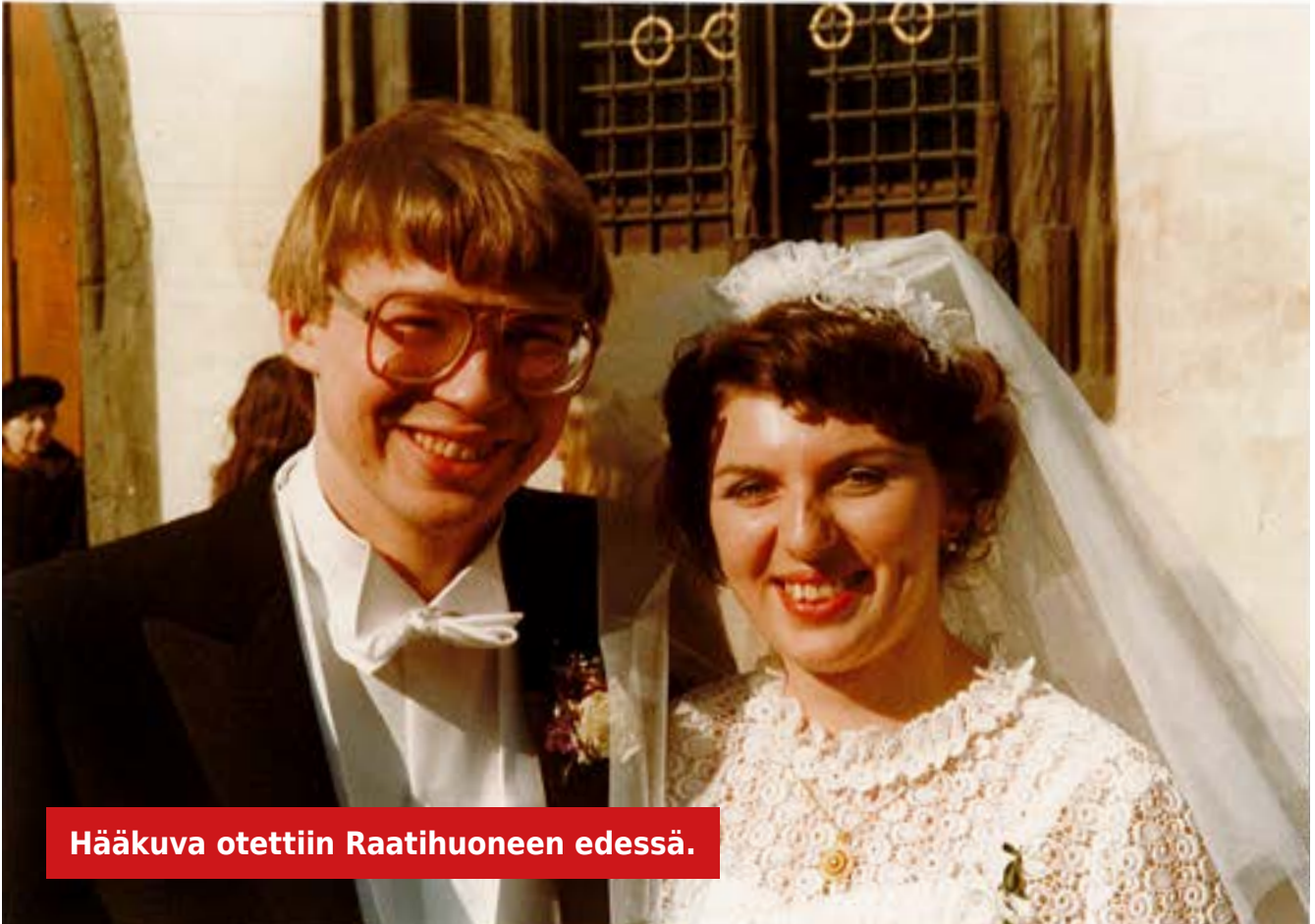
Hääkuva otettiin Raatihuoneen edessä.