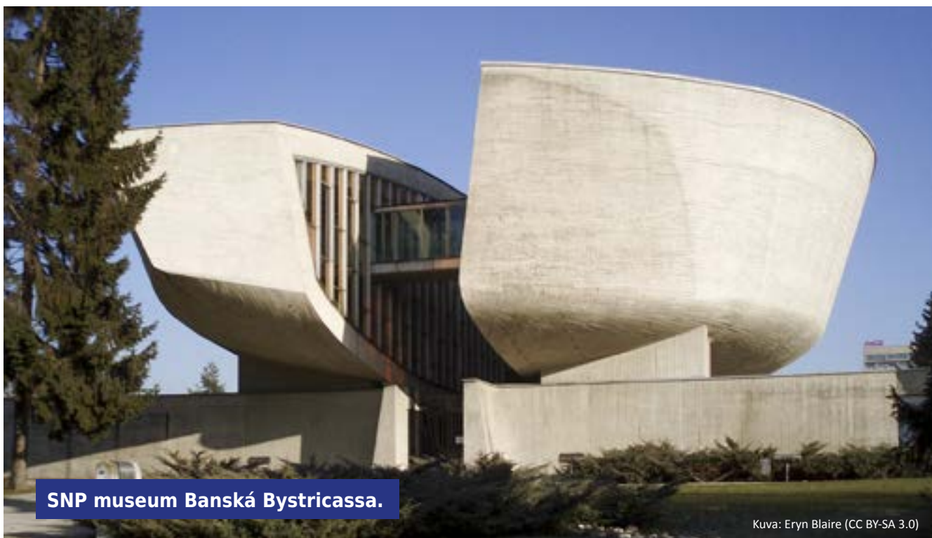
SNP museum Banská Bystricassa.