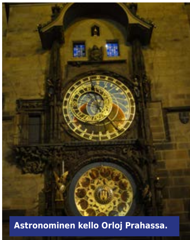
Astronominen kello Orloj Prahasa.